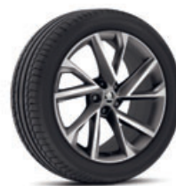
20" disky VEGA z ľahkej zliatiny doplnková výbava