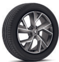
19" disky TRIGLAV z ľahkej zliatiny základná výbava