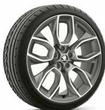
19" disky MANASLU z ľahkej zliatiny – antracitové