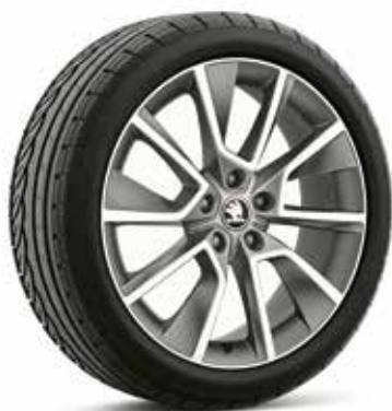
18" disky BRAGA z ľahkej zliatiny – antracitové

Všetky motory na splnenie limitov emisného predpisu EU6 využívajú filter pevných častíc na zachytávanie a redukciu nespálených pevných častíc výfukových plynov. Motory TDI využívajú systém SCR (Selective Catalytic Reduction), ktorý pomocou dodatočného vstrekovania AdBlue znižuje emisie NO x . Toto aditívum je nutné počas prevádzky vozidla dopĺňať.